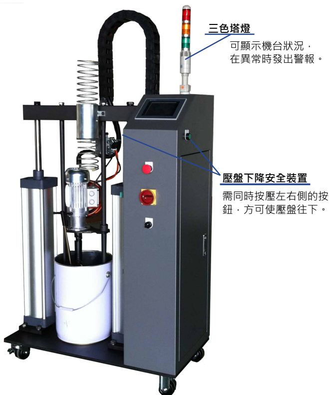
▲ CT5R壓盤式精密定量膠機