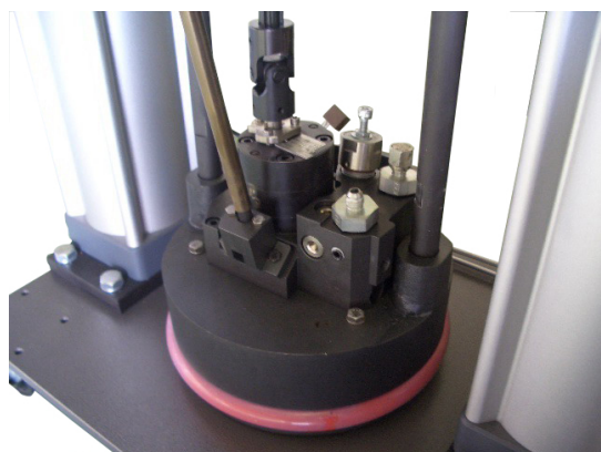
◀ CT5R使用之直徑286 mm壓盤