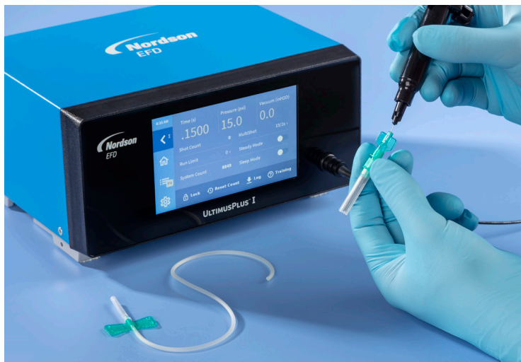
直观的触摸屏界面可简化设置和编程, 感受市场领先的使用体验。

使用诺信EFD的UltimusPlus™点胶机, 感受全新的使用体验。直观的触摸屏控制点胶参数, 可在数秒钟内培训操作员。UltimusPlus旨在简化设置和操作, 使操作员专注于精确、可控的点胶。操作员可以完全锁定时间、压力和真空设置, 从而改善工艺控制。